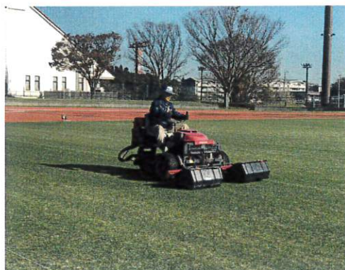
(陸上競技場芝刈り作業)