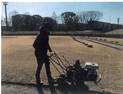
(野球場芝張替え作業)

電球交換や小破損などの小規模修繕を職員自らがを行い経費の削減に努めるとともに、利用者が常に安全かつ快適に利用できるよう施設の管理を行いました。