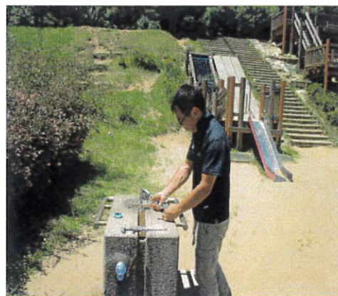
(水飲み場蛇口交換作業)