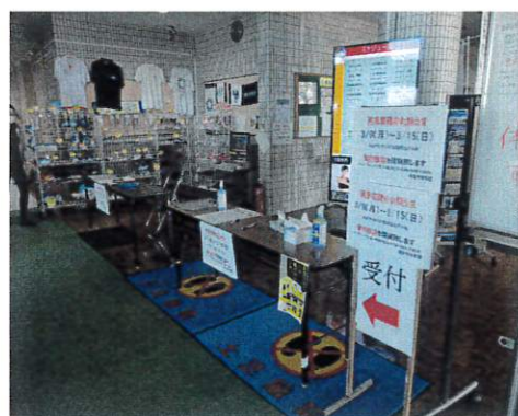
(健康チェックスペース)