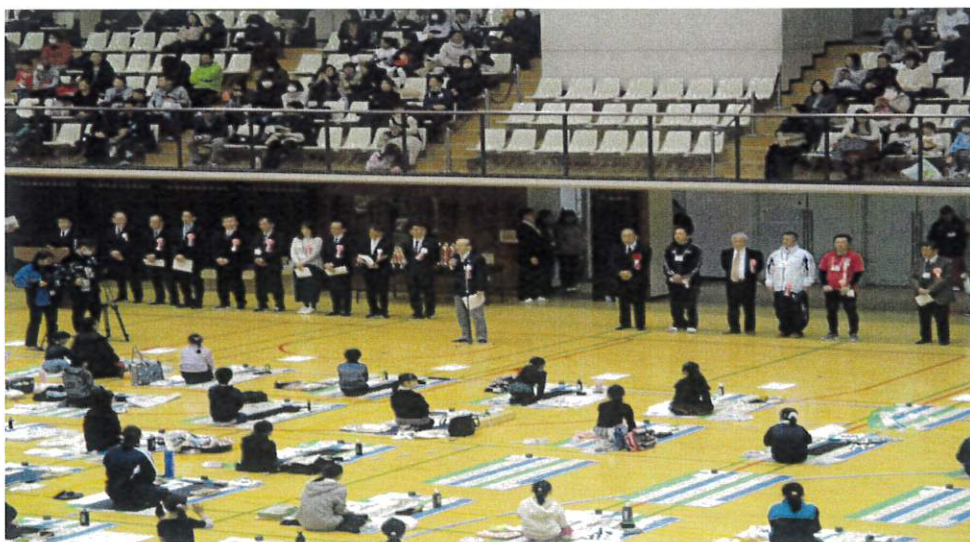
(成田市書初め大会)

また、体育館に空調設備が設置され、四季を通じて快適に利用することが出来る環境が整ったことから、青少年の健全な発展及び伝統文化に触れる機会の場の提供を行うことを目的に、昨年度から開催している成田市書初め大会を今年度も成田市及び成田市教育委員会との共催で開催いたしました。